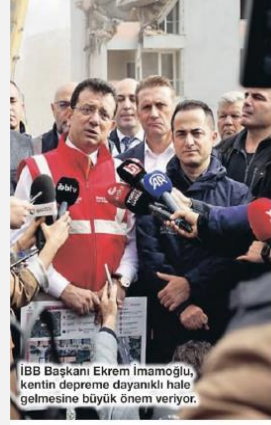
İBB Başkanı Ekrem İmamoğlu, kentten depreme dayanıklı hale gelmesine büyük önem veriyor.

Megakentte dönüşüm seferberliği başlıyor. Öncelik kendi ağırlığını taşıyamayan binalara verilecek. Bu binalarda yaşayan 80 bin kiraçısı aylık 7 ile 9 bin lira arasında yardım yapılacak